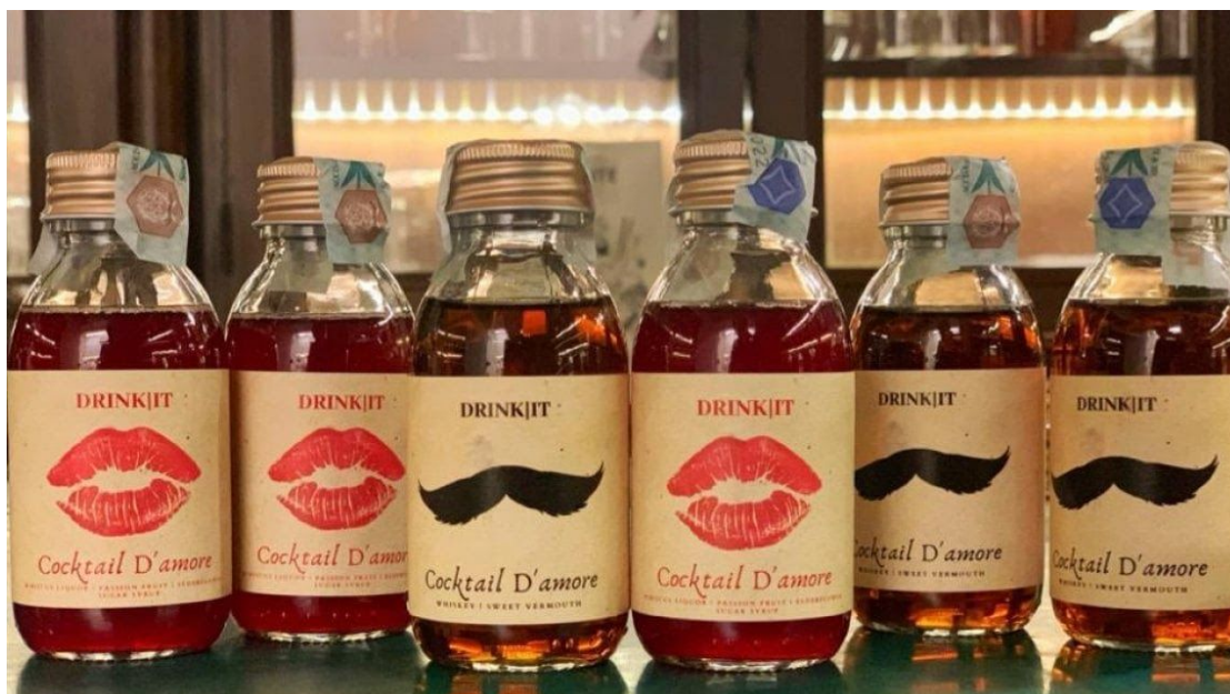
I cocktail imbottigliati di Drink.it