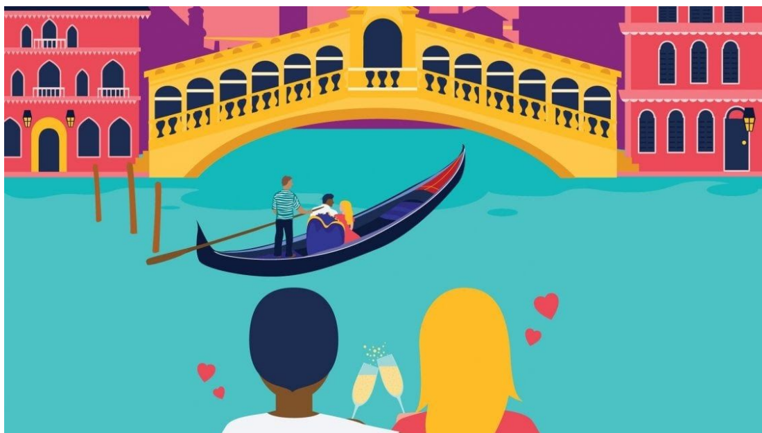
Uno dei tour virtuali di Tiqets