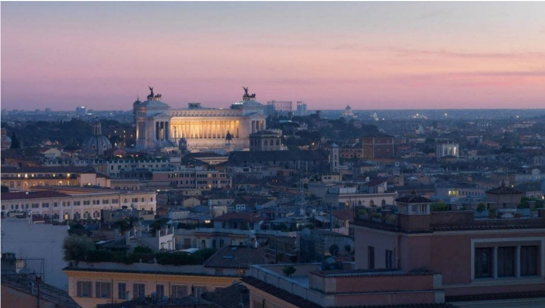
La vista dall'Hotel Eden di Roma

Fuori regione, fuori Paese, fuori dal letto. Saranno tantissime le coppie che quest'anno non potranno trascorrere San Valentino insieme a causa delle limitazioni dovute alla pandemia. Coppie che hanno alle spalle un anno difficile fatto di grande lontananza e pochi incontri e per le quali mantenere vivo il desiderio è diventato un imperativo. Tra romanticismo e videocchiamate, a San Valentino sono in tanti a proporre soluzioni più sensuali che possano avvicinarsi alla sensazione irripetibile di fare l'amore. In attesa di ritrovarsi dal vivo, l'azienda internazionale specializzata in prodotti per il piacere We-Vibe propone tramite la app We Connect la possibilità di muovere da remoto una gamma di sex toys di nuova generazione. Connettendosi da mobile è possibile controllare le vibrazioni e far aumentare l'intensità, creare vibrazioni personalizzate per intensità e durata e vivere l'esperienza in simultanea. Non solo, a chi acquista i prodotti We-Vibe per San Valentino viene offerta una quota ricongiungimento dedicata a tutte le coppie separate dal Covid che riceveranno buoni per prenotazioni di voli aerei e alberghi da utilizzare quando potranno ricongiungersi ai loro amati.